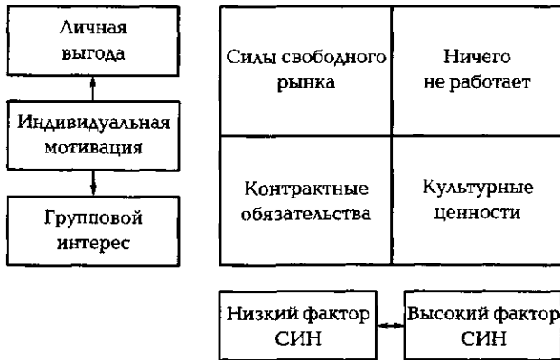
Рис. 10.1. Выбор метода контроля

Составляют простую схему, состоящую из четырех квадратов (рис. 10.1).